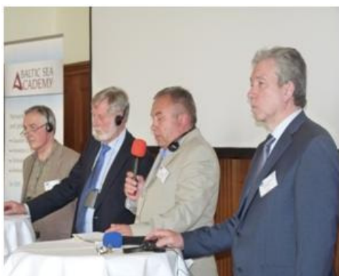
Konferencja Hanzeatycka 2012 w Hamburgu

Pełne wersje wykładów i rezultaty grup roboczych opublikowane zostaną teraz w formie książki, która ma się pojawić w listopadzie 2012.