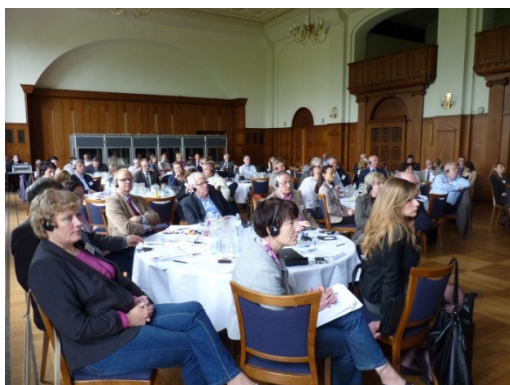
Konferencja Hanzeatycka 2012 w Hamburgu

Całkowite rezultaty Konferencji Hanzeatyckiej zostaną opublikowane w książce, która ukaże się w serii wydawnictw Baltic Sea Academy. Na tej podstawie Parlament Hanzeatycki opracuje polityczny program strategiczny „Innovation in Regional Policy for the Baltic Sea Region”, który ma zostać przedstawiony w listopadzie tego roku w Brukseli.