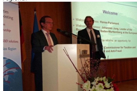
EU Commissioner Šemeta and Max Hogeforster

Parlament Hanzeatycki jest związkiem 50 izb przemysłowych, handlowych i rzemieślniczych, jak również innych instytucji wspierających klasę średnią z całego obszaru nadbałtyckiego. Członkowie mają łącznie pod opieką około 450.000 małych i średnich przedsiębiorstw. Celem Parlamentu Hanzeatyckiego jest wspieranie przedsiębiorstw klasy średniej z obszaru Morza Bałtyckiego i wzmocnienie konkurencyjności regionu.