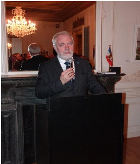
Jan Olbrycht, MEP

Parlament Hanzeatycki przedstawia kompaktową strategię odnośnie innowacyjnej polityki regionalnej w obszarze nadbałtyckim. Kluczowymi elementami są kooperacja międzynarodowa,