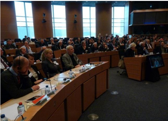
Project partners meeting in the European Parliament