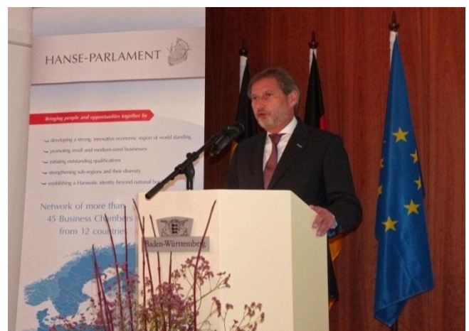
EU Commissioner Hahn at the meeting in Brussels

Na walnym zgromadzeniu Parlamentu Hanzeatyckiego i projektu QUICK 15/16 listopada w Brukseli zaprezentowane zostały opinie publicznej, w tym posłom do Parlamentu Europejskiego, jak również przedstawicielom komisji UE łączne rezultaty projektu QUICK. „Parlament Hanzeatycki przyczynia się w wartościowy sposób do osiągnięcia celów strategii nadbałtyckiej UE, przede wszystkim do wzrostu dobrobytu w regionie”, powiedział Johannes Hahn,