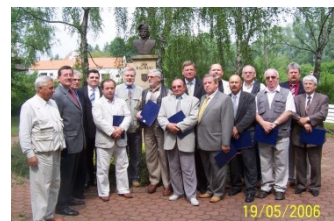
Aktualne władze Cechu

al. Niepodległości 2 61-874 Poznań tel./fax: 061 851 79 36 e-mail: biuro@rzembud.icech.pl http:// rzembud.icech.pl