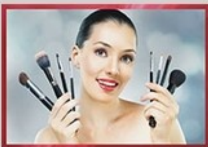
KURS PRZYGOTOWUJĄCY W ZAWODZIE WIZAŻYSTKA/STYLISTKA