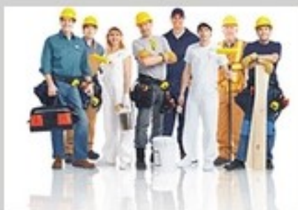
KURS PEDAGOGICZNY DLA INSTRUKTORÓW PRAKTYCZNEJ NAUKI ZAWODU