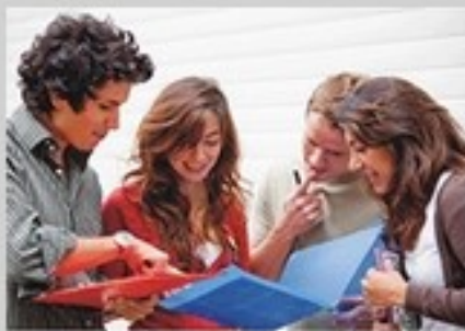
KURS PRZYGOTOWUJĄCY DO EGZAMINÓW CZELADNICZYCH I MISTRZOWSKICH