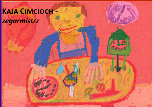
KAJA CIMCIOCH - zegarmistrz