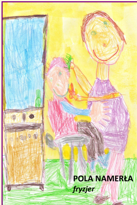
POLA NAMERŁA fryzjer