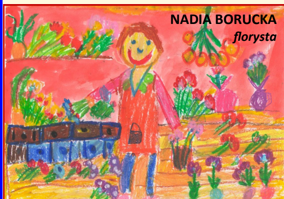
NADIA BORUCKA florysta