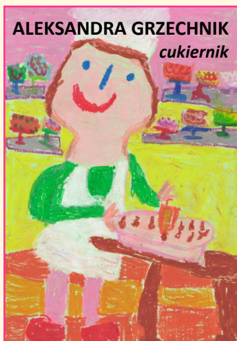
ALEKSANDRA GRZECHNIK cukiernik

Na konkurs plasty- czny w dwóch edycjach nadesła- no ponad 2600 prac plastycznych z 280 przedszkoli w Wielkopolsce.